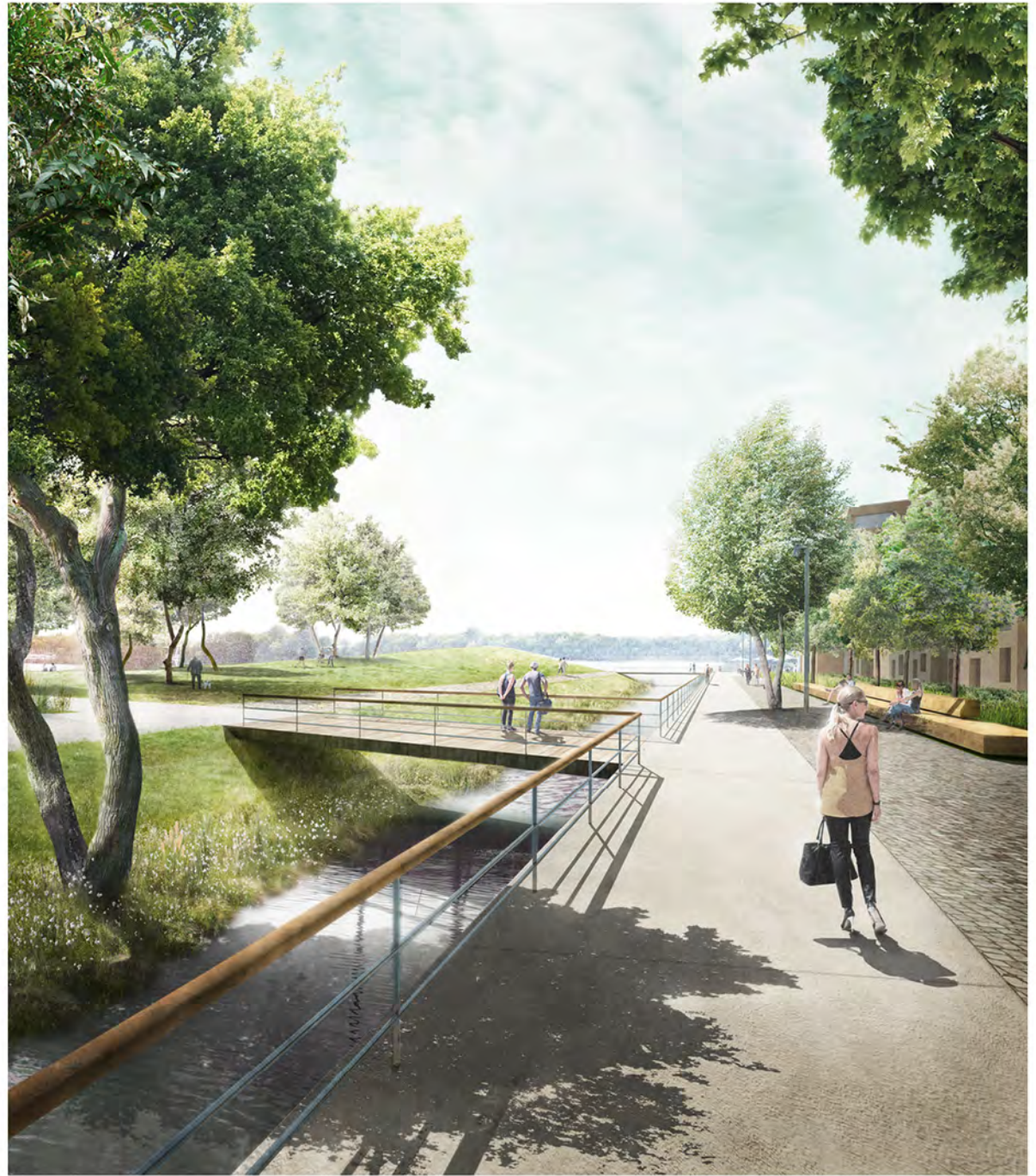
Längs des Bruchgrabens führt die Promenade vom Gleiswall zur Seeterrasse. Lindenbäume und lange Heckengärten rhythmisieren die Achse auf eine urbane Weise und geben den Blick in die Weidenaue frei.