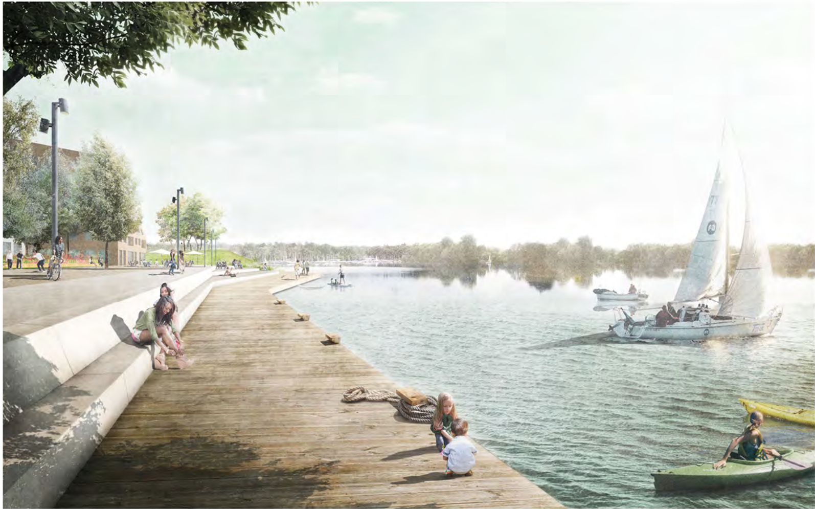
Der Höhenprung entlang der Promenade wird spielerisch als lange Bank an der Marina oder mit Sitzpodesten überwunden, von denen aus sich das Treiben auf dem Wasser in der Sonne beobachten lässt.